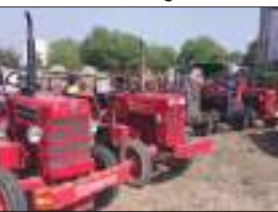
माही की गूंज, राजपुर।