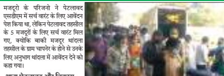
माही की गूंज, पेटेलबंदर।